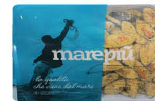
MARE PIÙ COZZE GRATINATE CON PANE AL POMODORO 1 kg