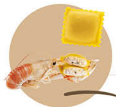
SURGITAL SCRIGNI RIPIENI AGLI SCAMPI surg. 2 kg