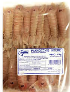
PANNOCCHIE INTERE IQF cong. al kg