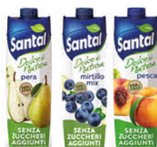
SANTAL SUCCO PRISMA ASS. SENZA ZUCCHERI AGGIUNTI 1 L 1,29 €