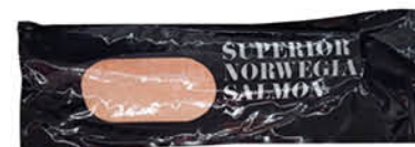
FILETTO DI SALMONE NORVEGIA TRIM C SKIN ON 1,4 - 1,8 kg al kg