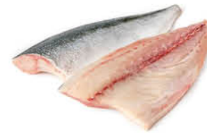
FILETTO DI RICCIOLA GIAPPONE HAMACHI AL KG