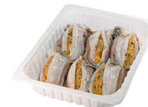
FISH FOR EVERY 1 SEPIA RIPIENA 2 kg