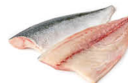
FILETTO DI RICCIOLA GIAPPONE HAMACHI al kg