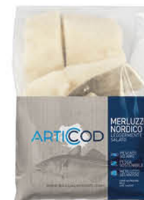
ARTICOD PORZIONI DI MERLUZZO NORDICO IQF 1 kg