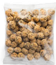
APERIFISH BOCCONCINI CROCCANTI TONNO TATAKI cong. 1 kg