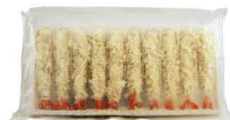
ASC MAZZANCOLLA IMPANATA EBI FRY 10 pz