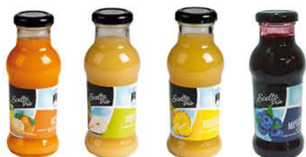
SCELTO PIÙ SUCCHI ASS. 200 ML ANANAS 200 ML MIRTILLO 200 ML