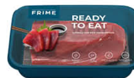
FRIME FILONE TONNO PINNE GIALLE MARINATO cong. in ATM al kg