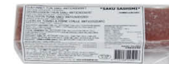
SAKU DI TONNO PINNE GIALLE al kg