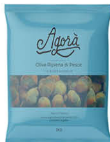
AGORA OLIVE RIPIENE DI PESCE surg. 1 kg