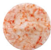
ROSSO MAZARA CARPACCIO BLEND DI GAMBERO 55 g