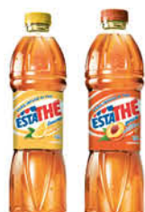
1,32 € FERRERO ESTATHÉ LIMONE/PESCA 1,5 L