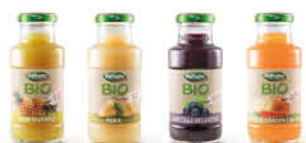
VALFRUTTA SUCCHI BIO ASS. 200 ML 0,79 € ANANAS 200 ML 0,95 € MIRTILLO 200 ML 1,25 €