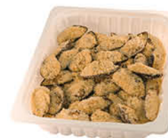
FISH FOR EVERY 1 COZZE GRATINATE 300/400 cong. 2 kg