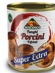
SERBOSCO FUNGHI PORCINI TRIFOLATI SUPER EXTRA LATTI 780 G

Il porcino di Serbosco, è un prodotto perfetto per bar, ristorante e pizzerie. Grande versatilità, facile utilizzo e tempi minimi di lavorazione, con conseguente risparmio dei costi di lavoro. Pronto all'uso per un aperitivo al bar, utilizzato come condimento per la pasta, come ripieno, ripassato in padella con erbe fresche ed accompagnato ad un secondo di carne, ideale anche sulla pizza e sulla bruschetta. La versione in latta è particolarmente funzionale, in quanto facilmente impilabile e apribile. Garantisce una resa qualitativa pari al prodotto fresco, in termini di gusto, profumo e consistenza, senza incorrere nelle problematiche di conservazione che sono tipiche del prodotto fresco.