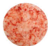
ROSSO MAZARA CARPACCIO UNICO MAZARA 55 g