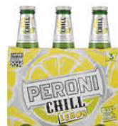
1,65 € PERONI BIRRA CHILL LEMON 3 X 33 CL