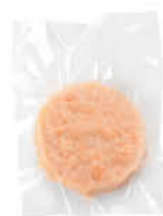
MAREPIÙ BURGER DI SALMONE cong. 100 g