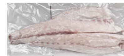
FILETTO OMBRINA ATLANTICA cong. 1-2 kg al kg