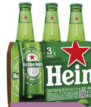
2,19 € HEINEKEN BIRRA 3 X 33 CL