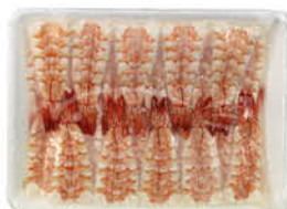
ASC SUSHI EBI 3 L. 8/8,5 cm