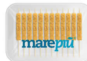
MARE PIÙ ARROSTICINI DI TOTANO GRATINATI 1 kg