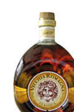
9,45 € VECCHIA ROMAGNA BRANDY CLASSICO 70 CL