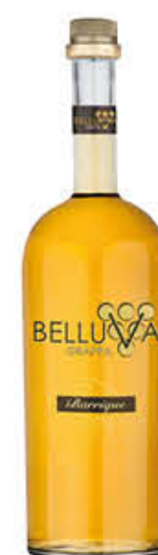
BELLUVA GRAPPA BARRIQUE 1 L