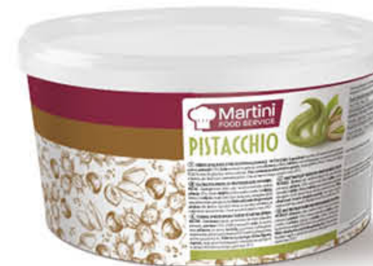
MARTINI CREMA AL PISTACCHIO 3 KG