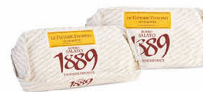
LE FATTORIE FIANDINO BURRO 1889 SALATO 100 G