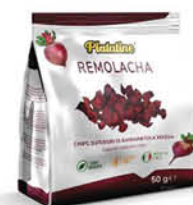
PLATINE CHIPS BARBABIETOLE ROSSE 50 G

È una specie qualitativa di patata dolce di origine Sud Americana, ricca di polifenoli e di vitamine dei gruppi A, C, B ed E. Avvolgenti chips di Batata, dal profumo fruttato, hanno un gusto bilanciato e persistente che, insieme con il crunch unico, le rendono perfette sia per uno snack dolce/salato che per guarnire piatti delicati.