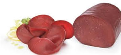
NEGRINI CARPACCIO AL NATURALE DI FESA 1/2 SV AL KG

Sono suadenti sfoglie di Barbabietola Rossa, il cui colore rosso rubino le rende simili a petali di rosa. La barbabietola, di origine mediterranea, è ricca di zuccheri, sali minerali e vitamine gruppo A e C, ha caratteristiche depurative, antianemiche e antisettiche. Dal gusto deciso e intenso aggiungono un tocco unico e raffinato ad aperitivi e portate principali: contorni crunch al posto delle patate classiche, come decorazioni o guarnizioni di piatti elaborati, perfette per insalatone e bowl.