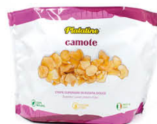
PLATINE CHIPS DI BATATA 500 G

Prodotti versatili, volti all'ottimizzazione di preparazioni o lavorazioni, dedicati a tutto il mondo Horeca.